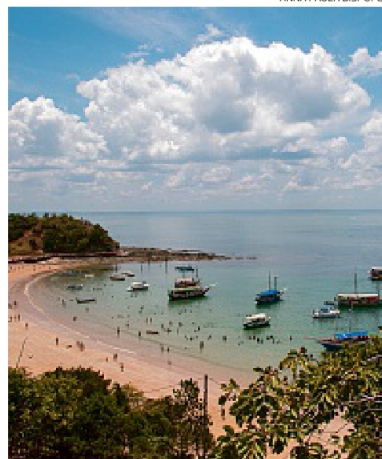
Ponta Nossa Senhora de Guadalupe, na Ilha dos Frades

linhas de ônibus da capital sofrerão mudanças a partir deste sábado (10). Uma delas é a 0207-Massaranduba x Itaigara, que terá seu nome alterado para 0214-Massaranduba x Estação BRT Hiper. O ponto final da linha, hoje na Rua Ceará, será agora a Estação do BRT em frente ao Big Bompreço da Av. ACM. A expectativa é que a espera no ponto diminua