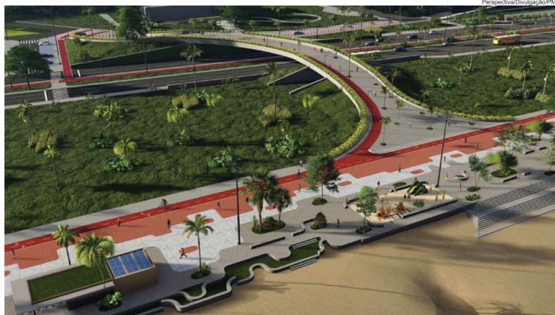
Perspectiva da nova Orla de Pituaçu, entre a Boca do Rio e Jaguaribe, onde as obras já começaram

De acordo com a Secretaria de Infraestrutura e Obras