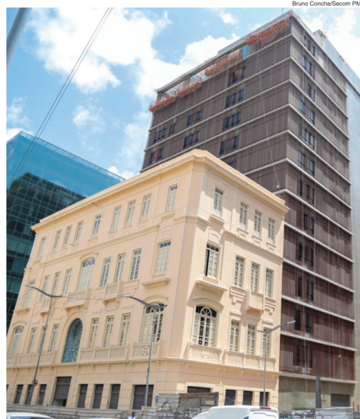
As obras da Casa de Histórias e Arquivo Público de Salvador seguem na reta final

Os trabalhos incluem ainda nova iluminação, reforma do revestimento interno das paredes, troca de telhado e implantação de sistemas elétrico, hidráulico e contra incêndio. O local também ganhou um elevador com capacidade para oito pessoas.