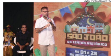
Programação das festas juninas da capital foi lançada pela Secretaria de Cultura e Turismo