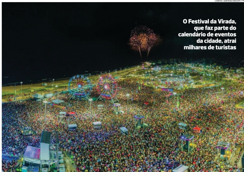
O Festival da Virada, que faz parte do calendário de eventos da cidade, atrai milhares de turistas

“Todo dia vai ter alguma atração para os turistas, com programação durante todo o ano. Não que as pessoas precisem de motivo específico para vir a Salvador, mas que ajude a atrair ainda mais visitantes”, destacou o secretário. Uma das novidades, segundo Tourinho, será o reforço na programação do Novembro Negro, com eventos