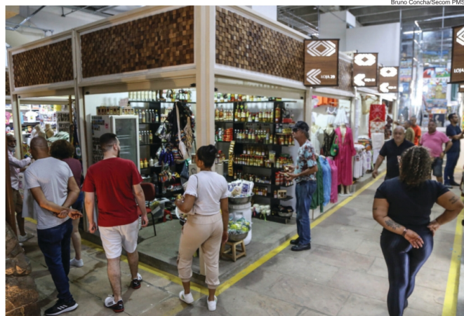
O Mercado Modelo está ganhando layout interno mais moderno e melhorias na infraestrutura

A primeira etapa das obras de requalificação do Mercado Modelo foi concluída, beneficiando 120 dos 260 comerciantes do centro de artesanato. Foram entregues novos boxes para comercialização de produtos, além de melhorias nas instalações. O investimento é