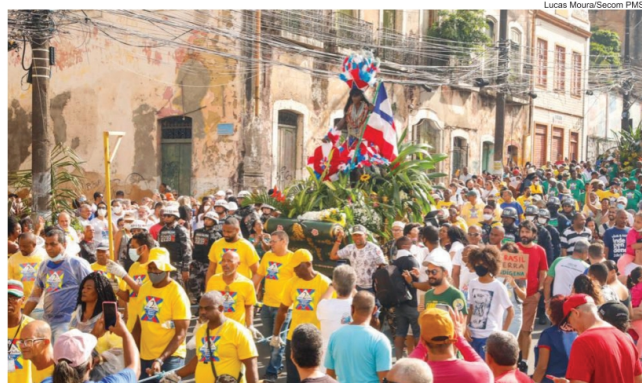
O desfile cívico do 2 de Julho será, mais uma vez, um dos destaques das comemorações

Salvador terá uma programação especial para comemorar aos 200 anos de Independência do Brasil na Bahia Com o tema “Salve nossa terra, Salve o Caboclo”, as festividades incluem a entrega do Memorial 2 de Julho e do novo Largo da Lapinha, além do monumento de Maria Felipa, na Praça Cairu. As comemorações terão início no dia 29 de junho e seguirão até 14 de julho, incluindo ainda apresentações culturais, ações em escolas e a volta do concurso de fachadas ao longo do percurso do desfile cívico.