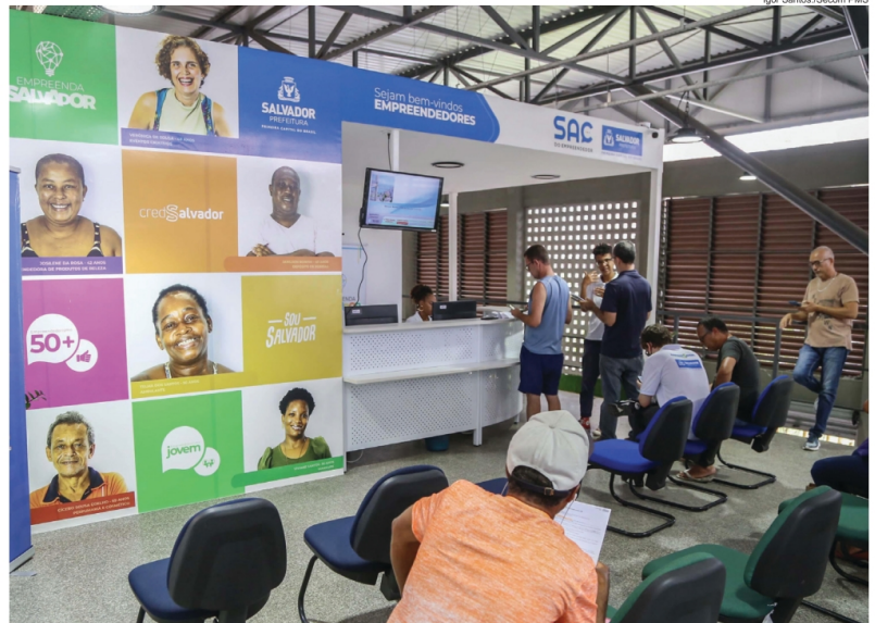
Um mutirão levou ações do programa, proporcionando orientação e dicas dos consultores