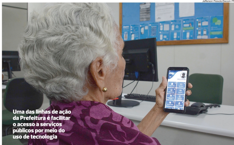
Uma das linhas de ação da Prefeitura é facilitar o acesso a serviços públicos por meio do uso de tecnologia

O prefeito Bruno Reis destacou, em editorial publicado no documento oficial do Plano, o quanto a tecnologia a serviço da qualidade de vida pode melhorar o dia a dia da população. "Não é à toa o sucesso do aplicativo utilizado pelos passageiros do transporte público, que podem saber o exato momento em que o ônibus vai passar no seu ponto", citou. Ele ainda exemplificou a iluminação em LED dos locais públicos, que, além de reduzir o con-