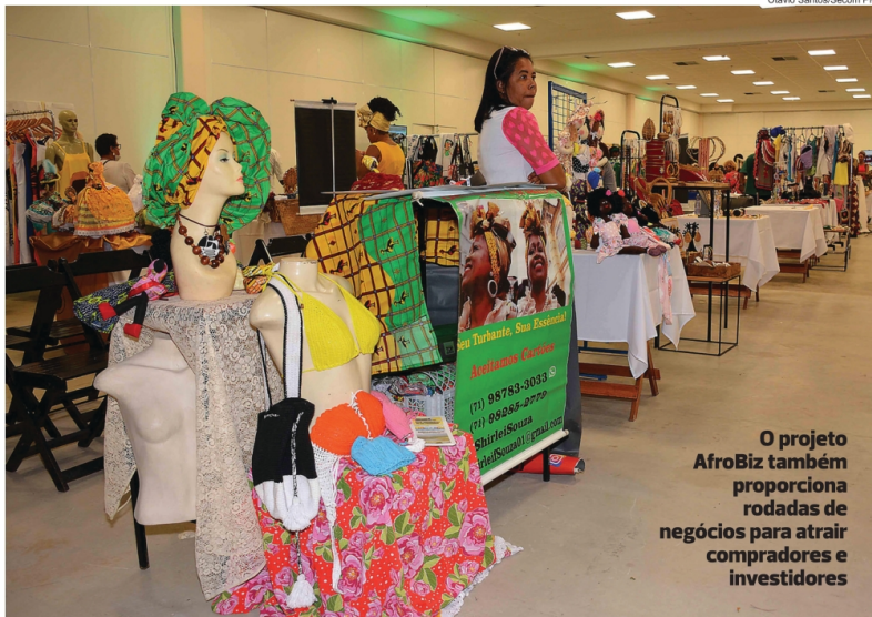
O projeto AfroBiz também proporciona rodadas de negócios para atrair compradores e investidores

O AfroEstima promoveu, nos dias 28 e 30 de março passado, um ciclo de palestras sobre afroempreende-