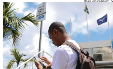
Pontos de internet sem fio gratuita podem ser acessados em diversas praças públicas e áreas turísticas