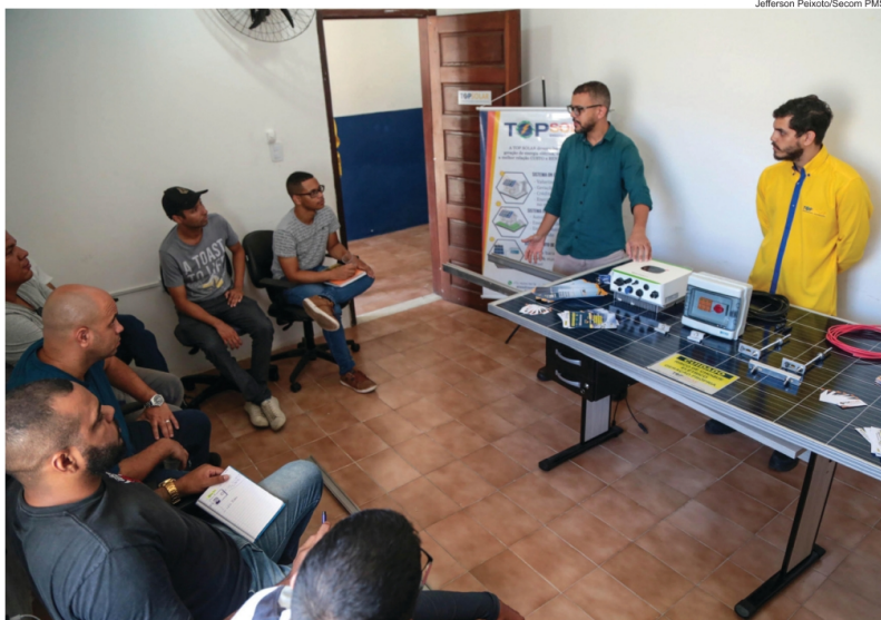
Jefferson Peixoto/Secom PMS