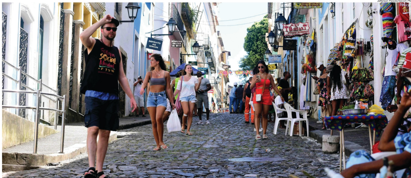
A grande procura dos turistas por Salvador pode ser constatada nas ruas e, principalmente, nos pontos turísticos da cidade

CRESCIMENTO Capital baiana recebeu mais de 2,3 milhões de visitantes na alta estação