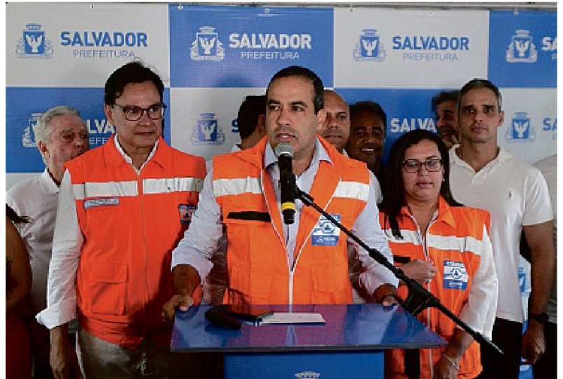
O prefeito Bruno Reis assinou a autorização de R$ 50 milhões para construção de 52 contenções de encosta

“Ao final do ano de 2023, quando essas obras forem concluídas, nós vamos ter mais de 500 áreas de risco protegidas em nossa cidade. Estamos investindo este ano R$ 127 milhões no enfrentamento das chuvas e na manutenção. É o maior investi-