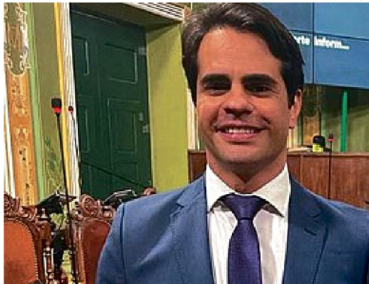
Marcos Vinicius Leal Gonçalves é acusado de assédio moral

A Justiça já havia decretado o afastamento do procurador em novembro do ano passado. Na época, a juíza substituta destacou que o afastamento de Leal seria