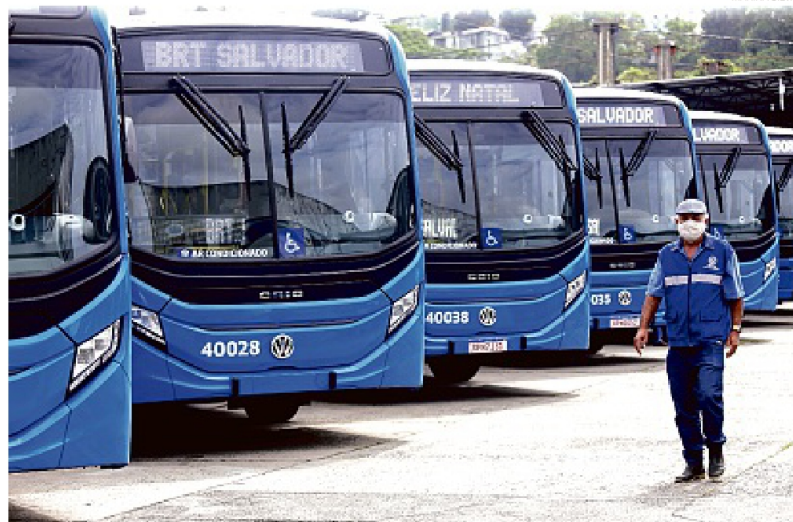
Os novos veículos entrarão em operação após a entrega da estação Pituba, prevista para janeiro de 2023

Em Salvador, o Festival Virada levará uma multidão à orla da Boca do Rio, entre os dias 28 de dezembro e 1º de janeiro. O presidente do Conselho Estadual indica que as pessoas completem o ciclo vacinal e evitem aglomerações caso tenham sintomas de gripe.