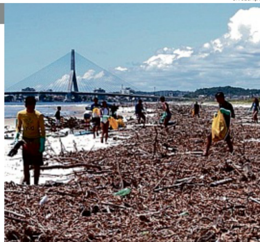
A briga por descarte de plantas aquáticas foi parar na Justiça

A estátua de Mãe Stella de Oxóssi, que já havia sido picada e tido uma placa arrancada, não é a única que precisou de restauração. As esculturas dos orixás instaladas no Dique do Tororó foram restauradas e entregues em setembro. Isso porque, em 2019, a peça de Oxumaré teve um dos braços arrancados.