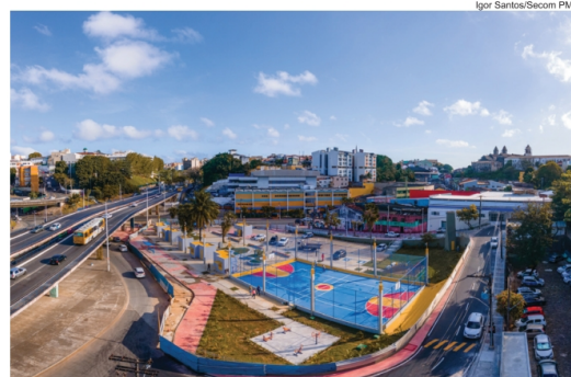
O antigo Terminal do Aquidabã deu lugar a uma nova praça

Este ano, a Prefeitura entregou o Memorial das Baianas de Acarajé, que voltou a integrar a lista de atrativos soteropolitanos. Situado na Praça da Sé, o equipamento passou por obras de revitalização, com investimento de R$545,4 mil. A curadoria do espaço foi coordenada pela Fundação Gregório de Mattos (FGM) e as obras foram executadas sob a supervisão da Secretaria Municipal de Infraestrutura e Obras Públicas (Seinfra), pro-