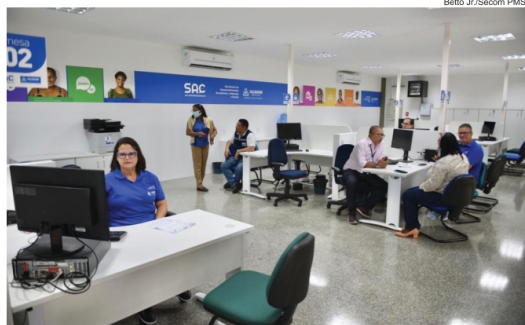
O SAC do Empreendedor reúne diversos serviços municipais em um só local