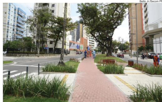
A Rua Sabino Silva, em Ondina, foi uma das vias que receberam diversas melhorias na cidade

Alguns dos principais corredores de tráfego da cidade estão mais modernos, confortáveis e com novo conceito, após obras de requalificação. Este foi o caso, por exemplo, da Avenida Milton Santos, antiga Adhemar de Barros, em Ondina. Com investimento de R$18,7 milhões, a via passou a proporcionar mais segurança e conforto a pedestres, ciclistas e motoristas.