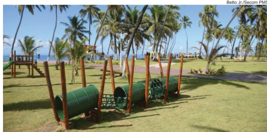
A Orla de Stella Maris foi um dos trechos totalmente requalificados e recentemente entregue pela Prefeitura

“As intervenções propostas na Orla consideram estudos e projetos diferenciados observando as identidades e especificidades de cada local especificamente. Buscou-se, através destes projetos, resgatar a sua funcionalidade e usos, mediante a valorização das suas vocações, símbolos e culturas, implantando as estratégias de uso e ocupação do solo e respeitando-se as áreas de Marinha e os condicionantes ambientais”, destacou a presidente da FMLF, Tânia Scofield.