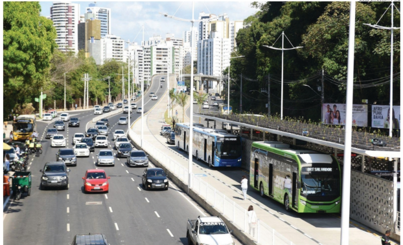
O BRT proporcionou um modal de transporte mais rápido e melhorou a mobilidade no trânsito

O prefeito Bruno Reis destacou que o BRT beneficiará 360 mil pessoas. Ele ainda ressaltou o pacote de ações que envolvem todo o sistema. “Além de ser uma obra de mobilidade, as obras do BRT resolvem problemas estruturais na macrodrenagem nesta região. Também percebemos a necessidade de solucionar problemas, a exemplo das ações no trânsito, em sinalizadoras, o mergulho da Avenida Tancredo Neves, resolvendo a mobilidade