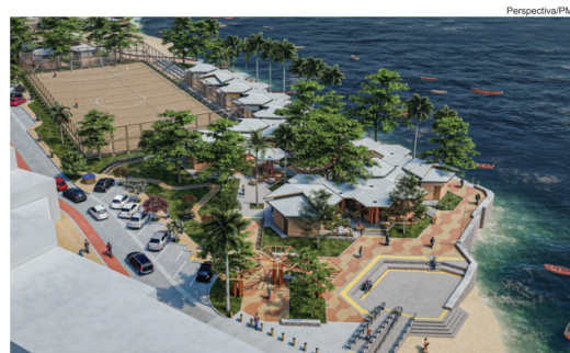
As obras do Porto da Lenha darão continuidade ao trecho do projeto já executado da orla da Ribeira

A Gamboa de Baixo é um local tradicional de pescadores onde vivem cerca de 400 famílias à margem da Bahia de Todos-os-Santos. A requalificação da área, coordenada pela Fundação Mário Leal Ferreira (FMLF), criará e requalificará espaços voltados à contemplação e recreação. O projeto amplia a área de orla existente, através da construção de contenções ao mar, que foram, no passado, destruídas pelas altas marés e nunca recuperadas.