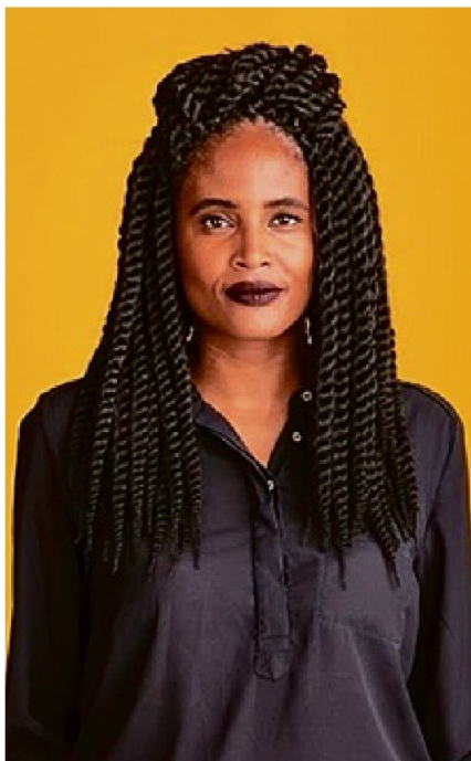
Djamila Ribeiro estará na mesa Avós, Filhas e Netas