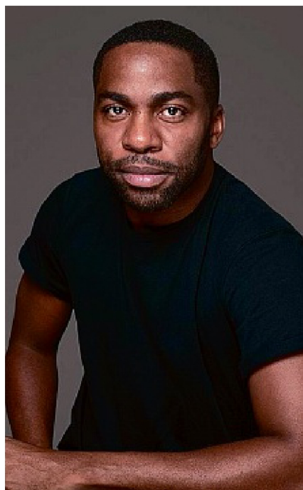
Lázaro Ramos lança livro voltado para o público jovem