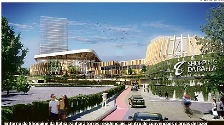
Entorno do Shopping da Bahia ganhará torres residenciais, centro de convenções e áreas de lazer

Um novo complexo conectará três torres residenciais e uma torre com lajes corporativas ao Shopping da Bahia, que passará a ter um centro de