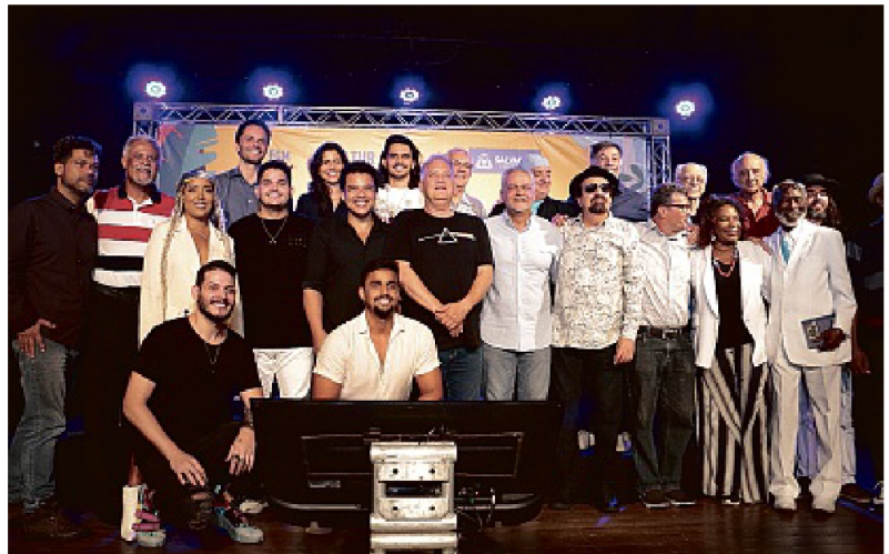
Artistas baianos de diferentes linguagens artísticas estão confirmados. Evento vai de 15 a 25 de setembro

No dia seguinte (18), o palco do Campo Grande irá receber o Projeto Tem Chorinho