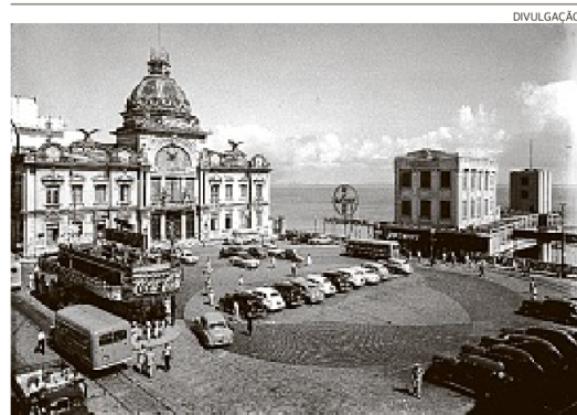
A mostra Minha Cidade, Minha História será aberta hoje, às 18h30

Abertura Amanhã, às 19h (para convidados), no Palacete das Artes, Graça. Visitação gratuita de 20/08 a 25/09, de terça a sábado, das 13h às 18h.