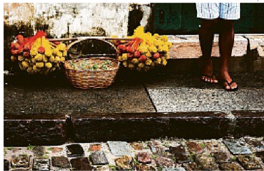
Foto de Emmanuel Correia na mostra Cotidianos Para Guardar - Bahia