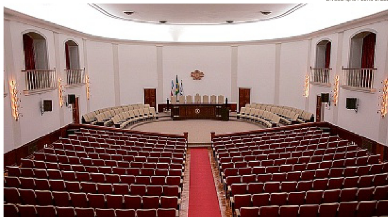
O local ganhou sistemas de climatização e sonorização modernizados, cadeiras e assoalhos recuperados

“O Salão Nobre é central na vida da Universidade, e a sua importância extraordinária se deve ao fato de ser o lugar das formaturas, dos atos políticos, de grandes seminários, de abertura e