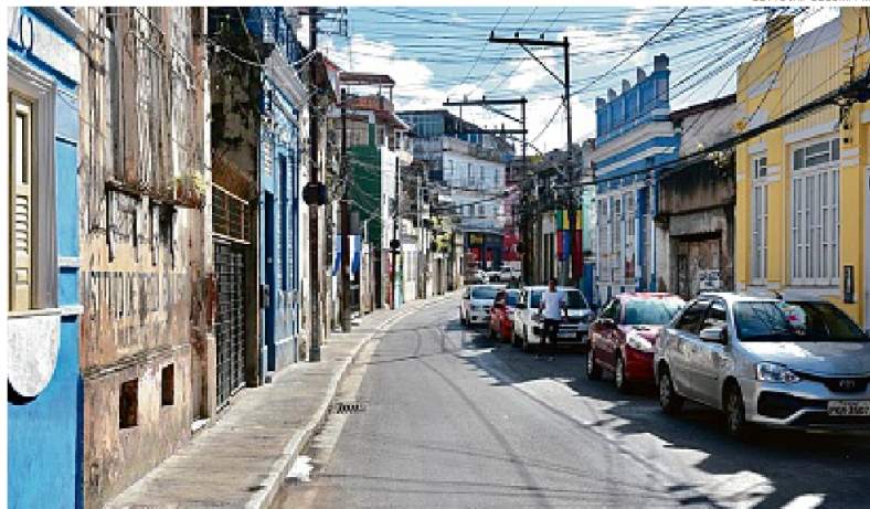
Via recebeu nova pavimentação e drenagem, com investimento municipal de R$ 1,6 milhão

SUSPENSÃO As campanhas de vacinação contra covid-19 e Influenza (gripe) estarão suspensas neste final de semana em Salvador. As estratégias serão retomadas na segunda-feira (4). Os locais de vacinação, público-alvo e horários da segunda serão divulgados no domingo (3). Em todo o estado, foram registrados 4.298 novos casos de covid-19 e nove óbitos, segundo o boletim epidemiológico da Secretaria Estadual de Saúde (Se-sab) divulgado na sexta-feira (1°). Dos 1.580.807 casos confirmados desde o início da pandemia, 1.538.803 já são considerados recuperados, 11.964 encontram-se ativos e 30.040 tiveram óbito confirmado. O boletim contabiliza ainda 1.910.560 casos descartados e 344.594 em investigação.