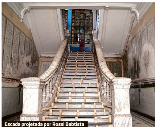
Escada projetada por Rossi Baptista