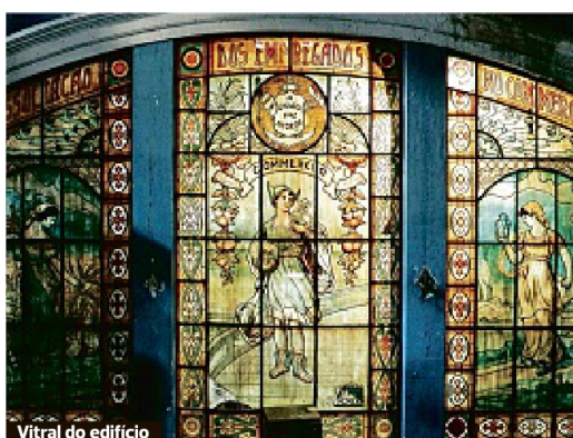
Vitrail do edifício