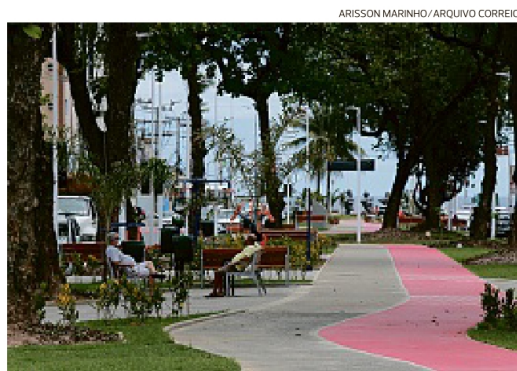
Via já teve parte da requalificação entregue pela Prefeitura

HOJE A Secretaria Municipal de Saúde de Salvador realiza hoje o mutirão J, com aplicação exclusiva da dose de reforço da Janssen contra a covid-19. A 1ª, 2ª e 3ª doses de outras fabricantes estarão suspensas, bem como as ações móveis nas estações de transbordo, aeroporto e rodoviária. Devem buscar os pontos de imunização as pessoas que tomaram obrigatoriamente a primeira dose da Janssen até 16 de julho deste ano e que estão com o nome no site da SMS. A apresentação do cartão de vacina é obrigatória. Hoje, a dose de reforço não se aplica a gestantes e puérperas. O boletim epidemiológico da doença, divulgado pela Sesab ontem, registrou sete mortes por causa da covid-19 nas últimas 24h. Os dados completos não foram divulgados por causa da instabilidade dos sistemas do Ministério da Saúde, que já dura seis dias. VEJA LOCAIS EM CORREIO24HORAS.COM.BR