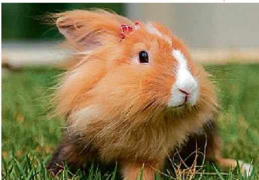
Tutora havia deixado a coelhinha lionhead no Jack's Pet Resort