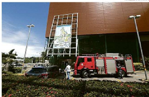
As causas do incidente no Salvador Shopping serão investigadas