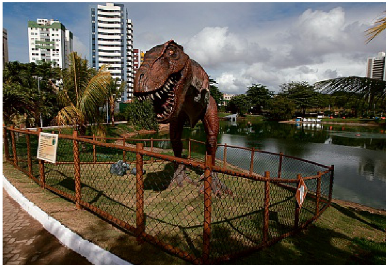
A partir do dia 26, não será mais necessário agendar visitas na Lagoa dos Dinossauros de terça a quinta

Os parques da Cidade (Itaigara) e dos Ventos (Boça do Rio) funcionarão de