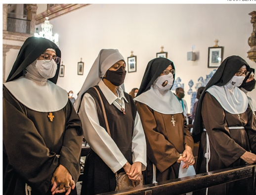
Celebração aconteceu no Convento Santa Clara do Desterro

A Celebração Eucarística aconteceu no Convento Santa Clara do Desterro, onde ela passou os últimos anos de vida. “Ela já é Serva de