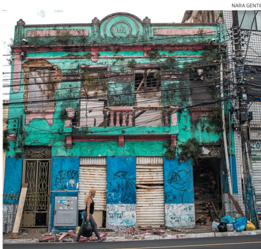
O imóvel voltou a registrar queda na parte superior da fachada ontem

Na última sexta-feira (16), a Codesal já havia interditado a passagem do imóvel – construído em 1927 –, que os moradores usam para acesso a suas casas localizadas no fundo, devido ao risco potencial. No local, há 46 casas habitadas, segundo o órgão, que afirma que os eventos se devem ao avançado estado de degradação e