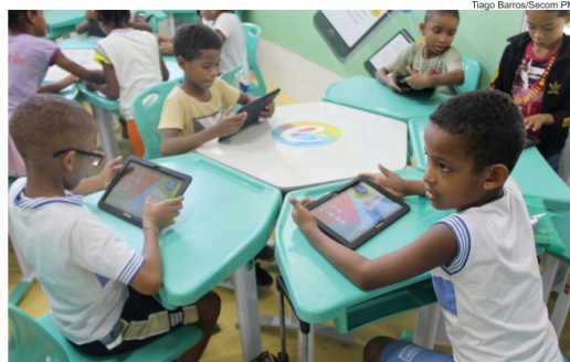
Na foto, alunos em aula antes da pandemia.

O trabalho pedagógico também é apoiado por conteúdos produzidos especificamente para tablets e computadores. Em um espaço chamado Maker, por exemplo, os estudantes aprendem, com elementos físicos, desconstruir e cons-