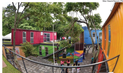
Max Haack/Secom PMS

A estrutura é totalmente sustentável e conta com escritórios compartilhados, auditório e salas de reunião