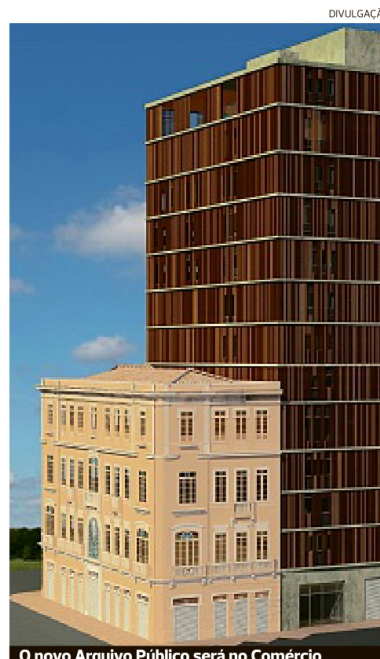
O novo Arquivo Público será no Comércio