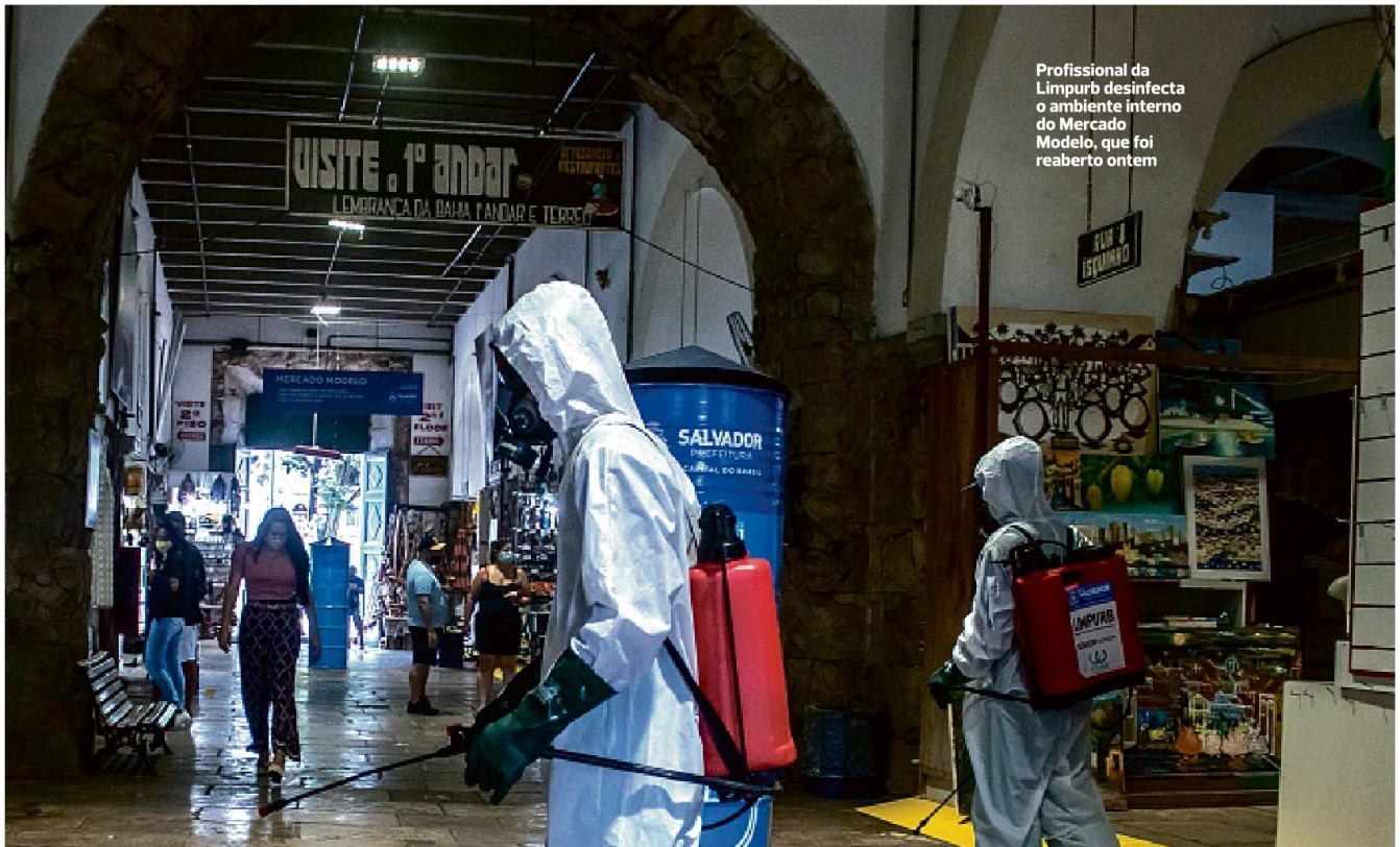
Profissional da Limpurb desinfecta o ambiente interno do Mercado Modelo, que foi reaberto ontem