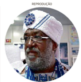
REPRODUÇÃO Agnaldo tinha 72 anos

A escultura a Clériston Andrade foi inaugurada em 1983, tem 14 metros e é feita com alumínio, cobre, mármore e concreto. A obra homenageia Clériston Andrade, ex-prefeito de Salvador que morreu em 1982 em um acidente de helicóptero - na época, ele fazia campanha para o governo da Bahia.