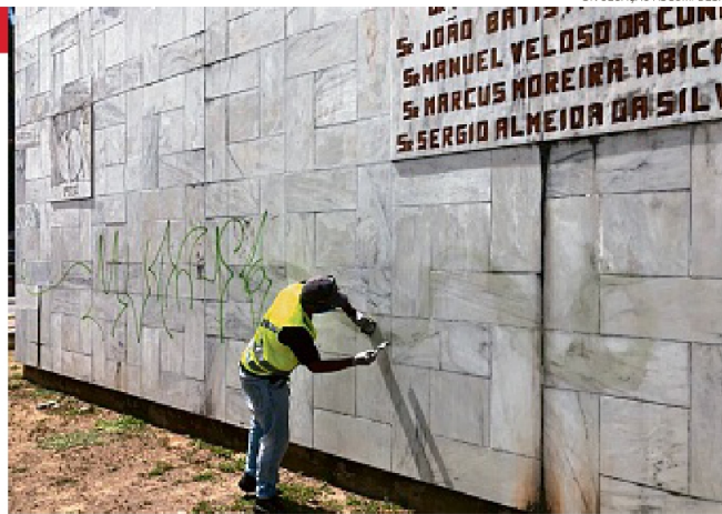
A escultura a Clériston Andrade foi inaugurada em 1983 e tem 14m de altura

Ainda segundo a Companhia, qualquer ato de vandalismo pode ser denunciado através do Fala Salvador, pelo telefone 156, ou pelo site www.falasalvador.ba.gov.br . A punição