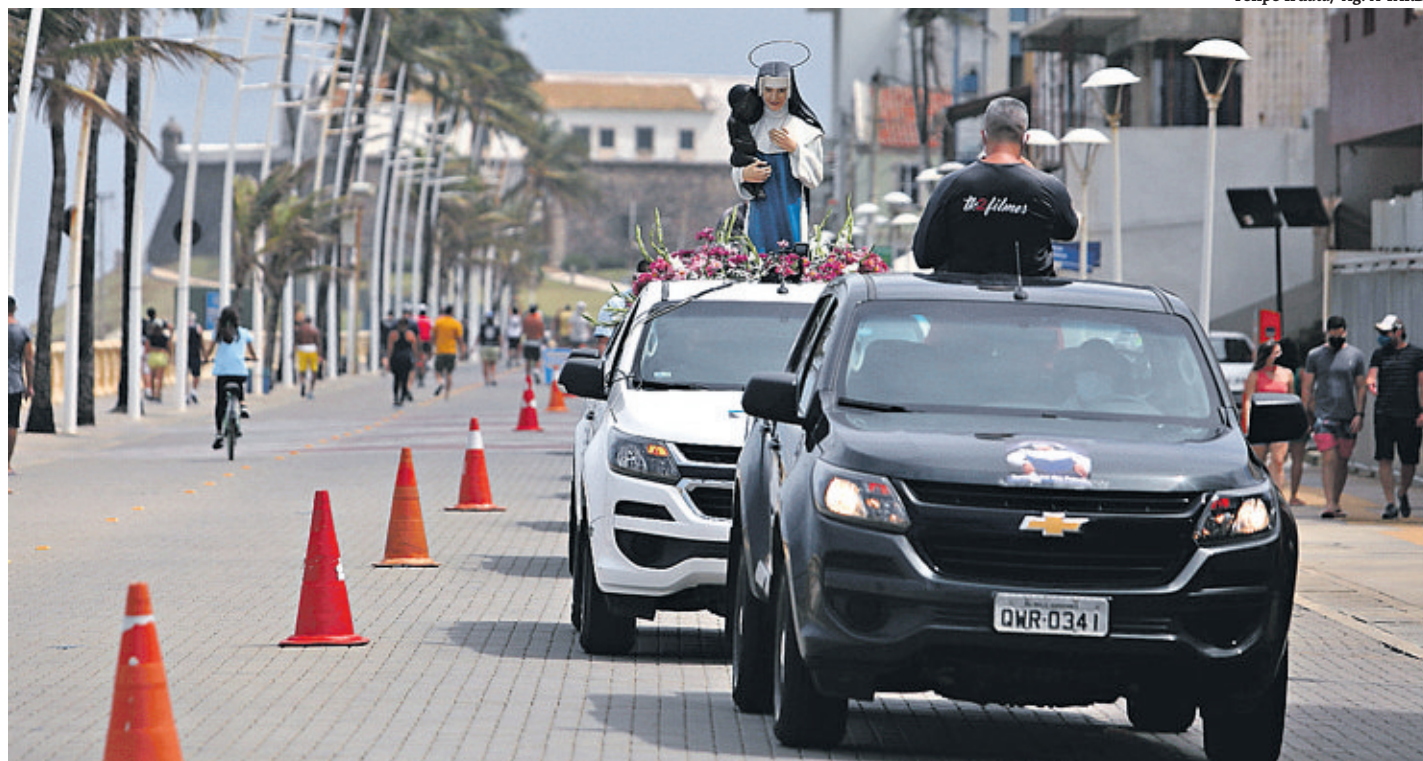
A imagem de Santa Dulce foi levada para vários bairros da cidade e toda a rota foi transmitida em tempo real

A peregrinação começou 10h e durou até 15h30. Para o reitor do Santuário de Santa Dulce, um momento de muita força foi a passagem da imagem pela Basílica do Senhor do Bonfim. Outros espaços que a imagem também passou foram: avenidas Fernandes da Cunha, Jequieta e França, Ladeira da Montanha, Avenida Sete de Setembro, Porto da Barra, Ondina, Rio Vermelho, Amaralina, Pituba, Boca do Rio, Patamares, Piatã e Avenida