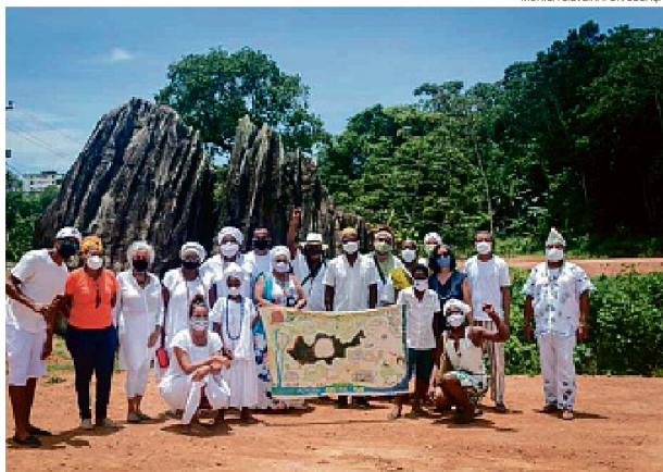
Representantes de Terreiros se reuniram no sábado para reverenciar Xangô

No sábado (20), representantes das Comunidades de Terreiros das nações Angola, Jeje, Ketu e Umbanda do entorno da Pedra de Xangô receberam ativistas e lideranças religiosas do sítio natural sagrado Lagoa do Abaeté, e