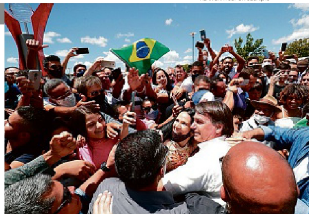
O presidente foi cercado por diversos apoiadores, muitos sem máscara