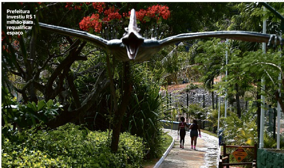
Prefeitura investiu R$ 1 milhão para requalificar espaço

Observação Se puder, evite ir de carro pois é difícil encontrar vaga de estacionamento