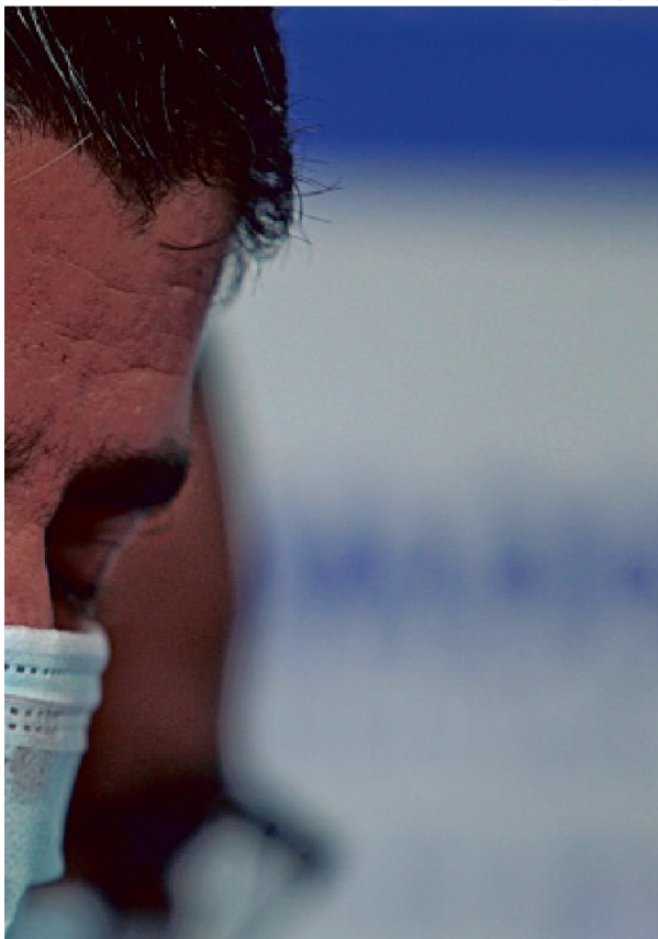
ASSINATURA DA FOTO

● Reforma da Unidade Básica de Saúde (UBS) de Paripe Ainda em 2013, ela foi a 16ª UBS entregue pela Prefeitura de Salvador, sendo a 8ª apenas no Subúrbio Ferrovário. A UBS de Paripe tinha sido inaugurada em 1982 e passou 20 anos sem receber qualquer tipo de intervenção na estrutura física, comprometendo a qualidade dos serviços prestados.