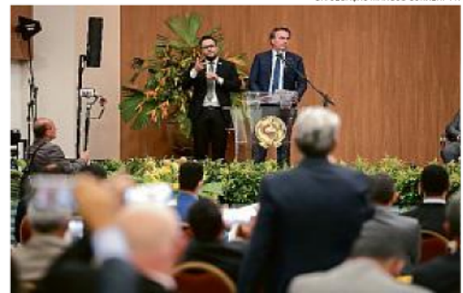
O presidente discursa rapidamente para os participantes

mortes em decorrência da doença já ocorreram na Bahia (uma letalidade de 2,01%)