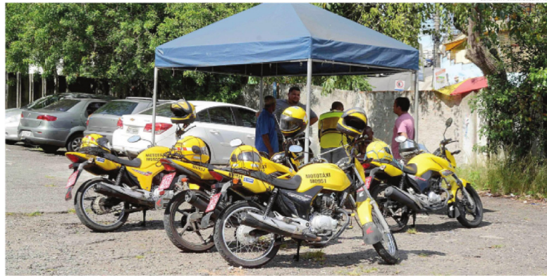
Os mototaxistas estão entre as categorias contempladas pelo Salvador por Todos