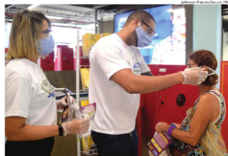
Mais de 200 mil máscaras são doadas para usuários do transporte público