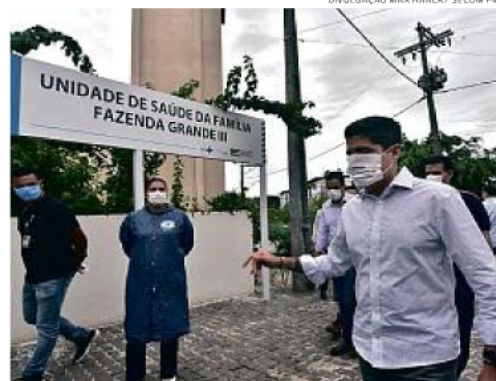
USF terá capacidade para 650 atendimentos médicos por dia

Medida, que vale para outras empresas, entrará em vigor nessa quinta (16)