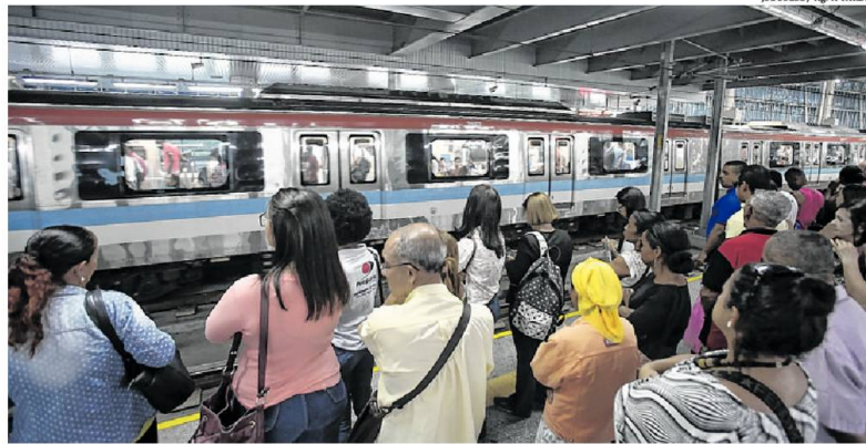
Joá Souza / Ag. A TARDE

Na prática, portanto, o acordo permite a interação entre os dois sistemas rodoviários sem custo extra para o passageiro. "Avançamos muito, apesar de terem