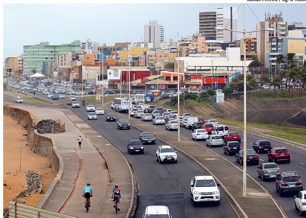
Principal mudança vai ocorrer na avenida Octávio Mangabeira, no sentido Pituba