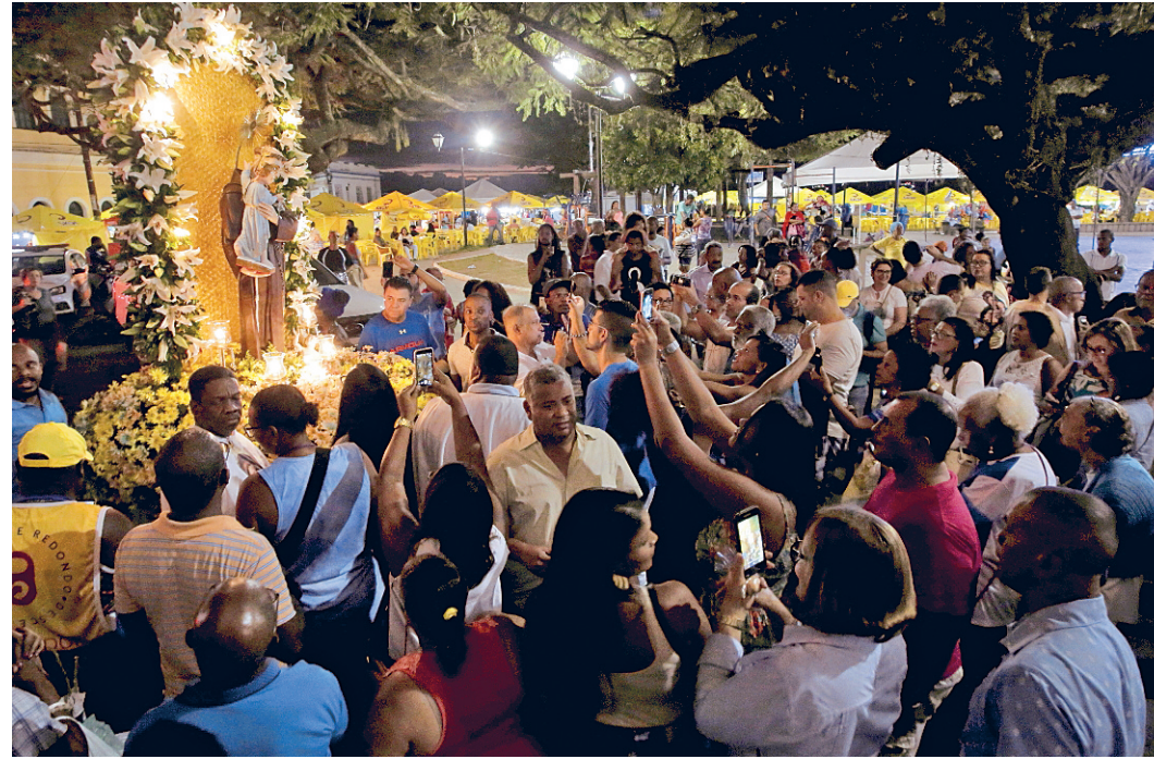
Católicos lotaram o largo do Santo Antônio Além do Carmo durante a celebração