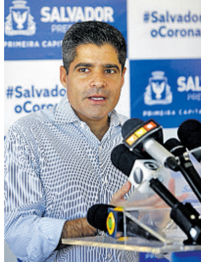
ACM Neto tem avaliação acima da de outros prefeitos baianos

Laryssa Machado / Ag. A TARDE / 7.4.2020