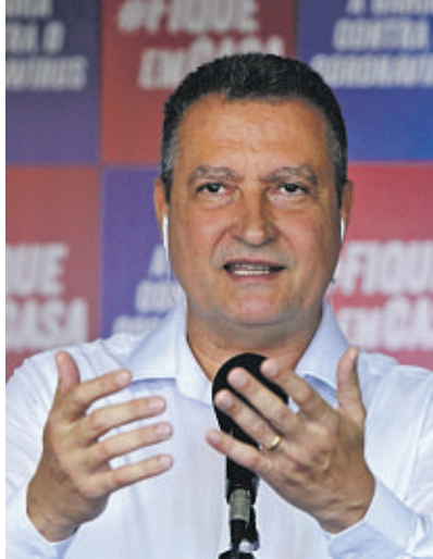
Ações de Rui encontram maior apoio nos mais ricos e instruídos

Como avalia o desempenho do prefeito de Salvador, ACM Neto, para combater o coronavírus?