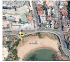
Rua da Paciência, Rio Vermelho