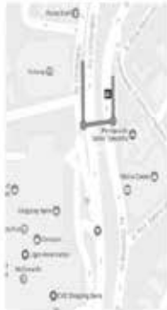
PONTO ESPECIAL DE FRETAMENTO DE ONIBUS: PARALELA X BARRA (SALVADOR) CARNIVAL 2024