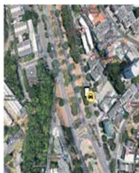
Av. Anita Garibaldi, acesso à Federação