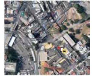
Rua de Saete, próximo à Faculdade Ceau