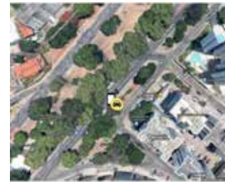
Av. Centenário, próximo à Praça Oscar Hilário - Centenário