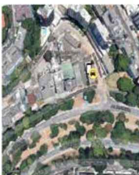
Av. Centenário, Rua Djalma Ramos