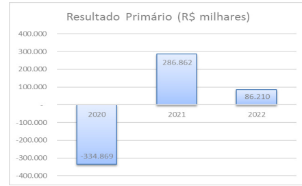
Gráfico 1 – Variação do Resultado Primário entre 2020 até 2022.

A respeito da evolução do resultado primário, nota-se que este passou, em 2020, de um déficit primário de R$ 334 milhões, motivado pelos impactos econômicos da pandemia, para superávits de R$ 286 milhões em 2021, com a retomada das atividades econômicas e de R$ 86 milhões no fim do exercício de 2022.