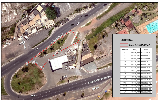
PROCESSO 76884/2021 e-Salvador Endereço: Avenida Octávio Mangabeira, s/n, Pituçu - Salvador/BA

PREFEITURA MUNICIPAL DE SALVADOR SECRETARIA MUNICIPAL DA FAZENDA - SEFAZ COORDENADORIA DE ADMINISTRAÇÃO DO PATRIMÔNIO IMOBILIÁRIO - CAP SECTOR DE OCUPAÇÃO - SEDON MAPA DE LOCALIZAÇÃO - SEDON SECRETARIA DE ORÇAMENTO E CONTABILIDADE - SECOR - SECO 206 ESCALA DO MAPA: 1:1.000 IMPRESSÃO: 07/16/2022