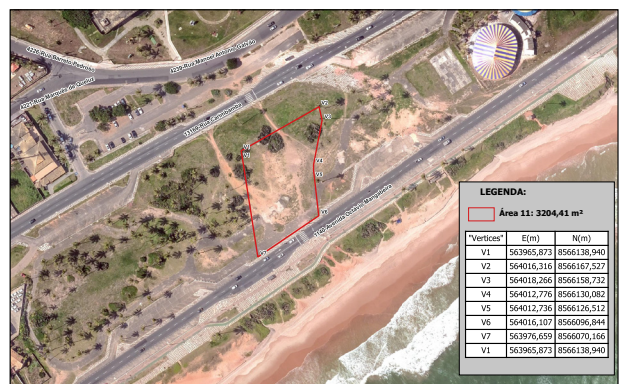
PROCESSO 76884/2021 e-Salvador Endereço: Avenida Octávio Mangabeira, s/n, Pituçu - Salvador/BA

PREFEITURA MUNICIPAL DE SALVADOR SECRETARIA MUNICIPAL DA FAZENDA - SEFAZ COORDENADORIA DE ADMINISTRAÇÃO DO PATRIMÔNIO IMOBILIÁRIO - CAP SECTOR DE OCUPAÇÃO - SEDON MAPA DE LOCALIZAÇÃO - SEDON SECRETARIA DE ORÇAMENTO E CONTABILIDADE - SECOR - SECO 206 ESCALA DO MAPA: 1:1.000 IMPRESSÃO: 06/16/2022