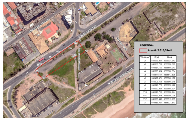
PROCESSO 76884/2021 e-Salvador Endereço: Avenida Octávio Mangabeira, s/n, Pituçu - Salvador/BA