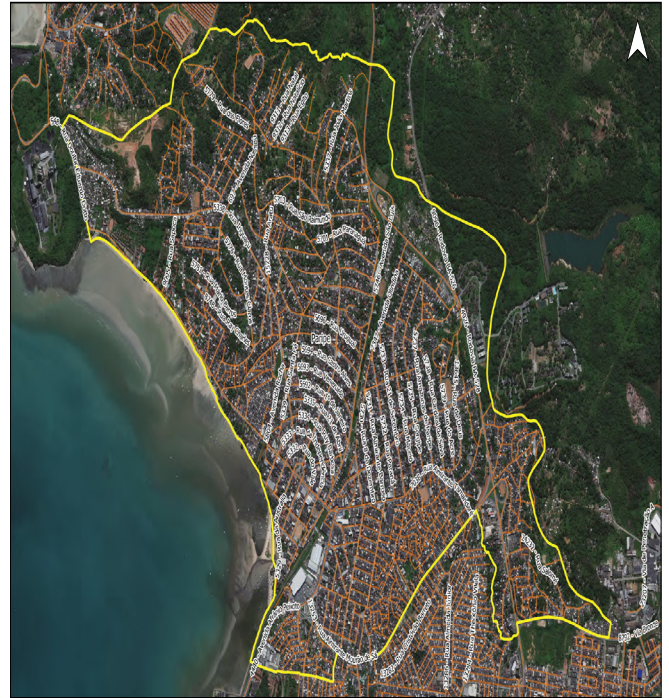
Código do Município: 3102007 Projeção: UTM - SRGUS 2000_24S Datum: S 5600 Linha Bairro: Paripé