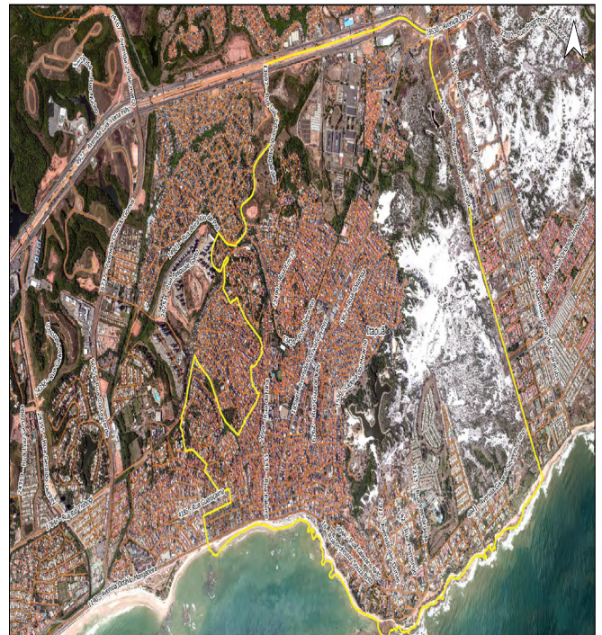
Fonte: IBGE/2010 Código do Município: 3102007 Projeção: UTM - SRGUS 2000_24S Datum: S 5600 Linha Bairro: Itapuí