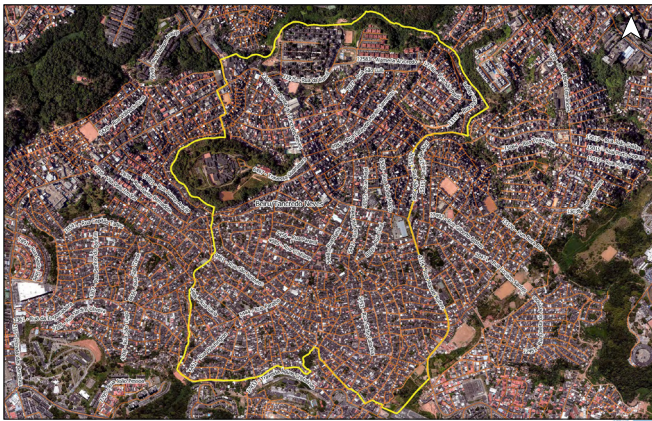
Código do Município: 3102007 Projeção: UTM - SRGUS 2000_24S Datum: S 5600 Linha Bairro: Santa Teresinha