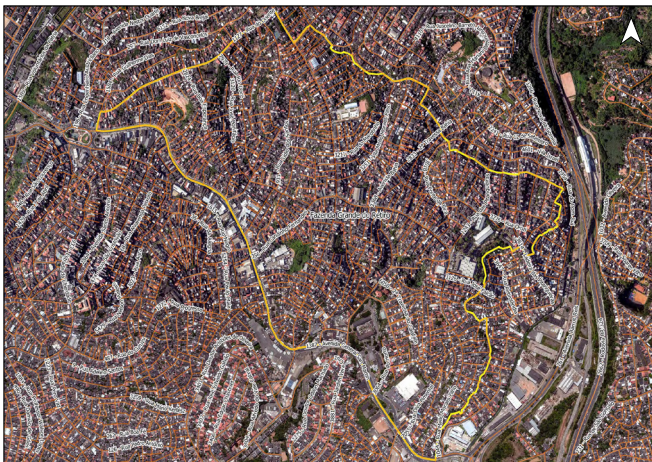
Código do Município: 3102007 Projeção: UTM - SRGUS 2000_24S Datum: S 5600 Linha Bairro: Fausto Grande de Sousa