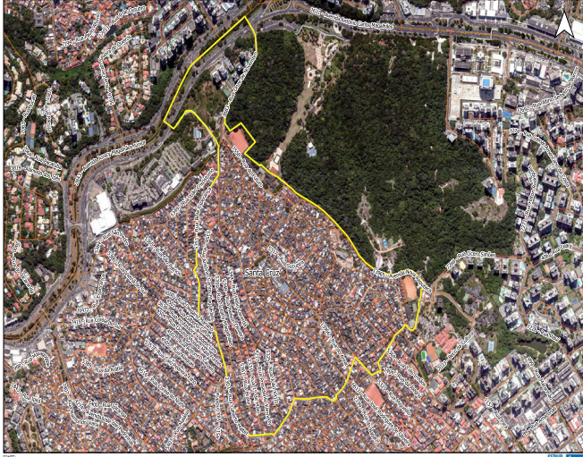
Código do Município: 3102007 Projeção: UTM - SRGUS 2000_24S Datum: S 5600 Linha Bairro: Santa Cruz