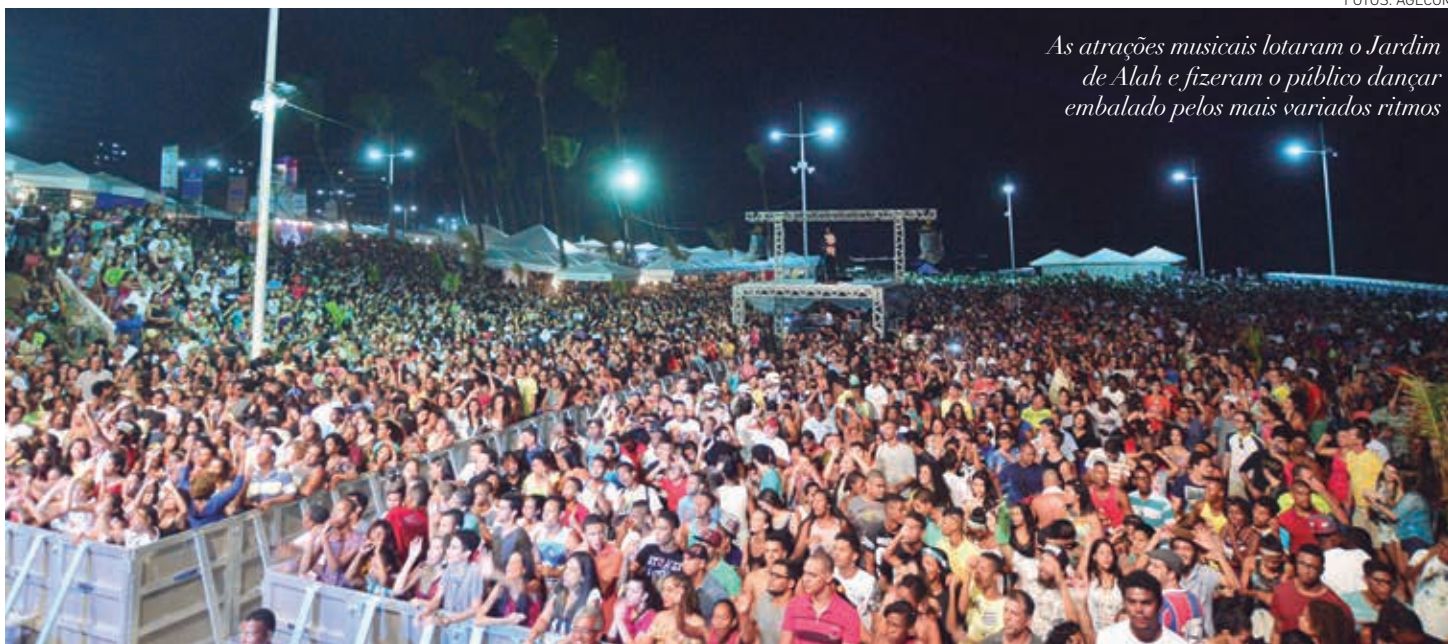
As atrações musicais lotaram o Jardim de Alah e fizeram o público dançar embalado pelos mais variados ritmos