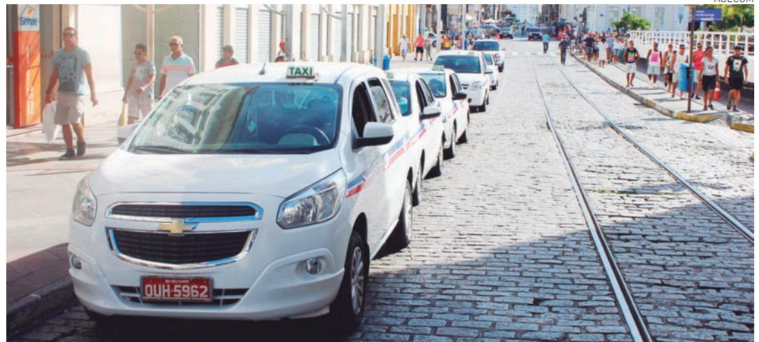
A vistoria se estenderá até novembro, numa média de 120 carros por dia, de segunda a sexta, das 7h30 às 16h30

de largura e 1,0 cm de distância entre ambas. O número do alvará deve ser pintado nas laterais do veículo, entre as faixas, e na parte traseira, no canto superior direito, ambos com 8,0 cm de altura, também na cor azul arara.