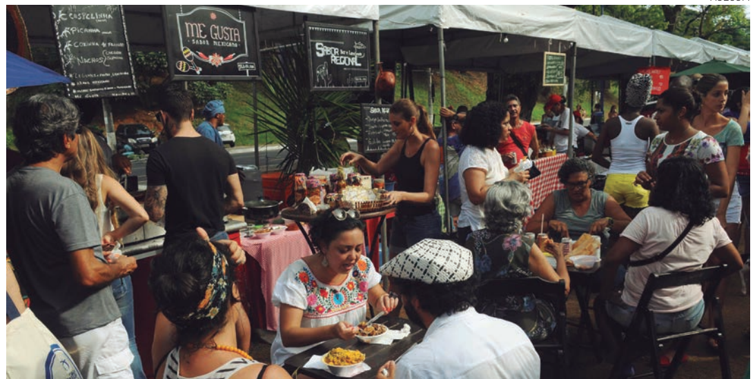
A Feira da Cidade no Pelourinho vai estreiar, como novidade, o projeto Barraca da Cozinha Africana

gratuito, de uma hora, pelas ruas do Pelourinho, acompanhado por um guia. Para participar do tour é preciso se inscrever pela fanpage da Saltur no Facebook ( www.facebook.com/salturpms ) até esta sexta-feira. Serão 30 vagas para o passeio.