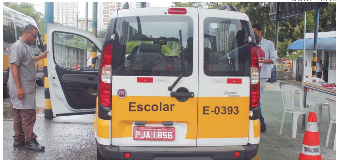
A vistoria prossegue hoje, no Vale dos Barris, quando serão atendidos os veículos com alvarás de 0101 a 0200