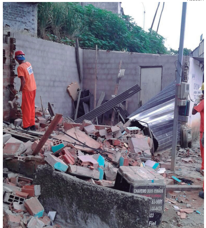
Os agentes demoliram quatro boxes construídos em área pública e sem licença

Além das demolições dos quatro boxes comerciais irregulares, os agentes da Sucom apreenderam 500 blocos cerâmicos que seriam utilizados para obras em desacordo com a legislação e removeram, ainda, quatro caminhões de entulho.