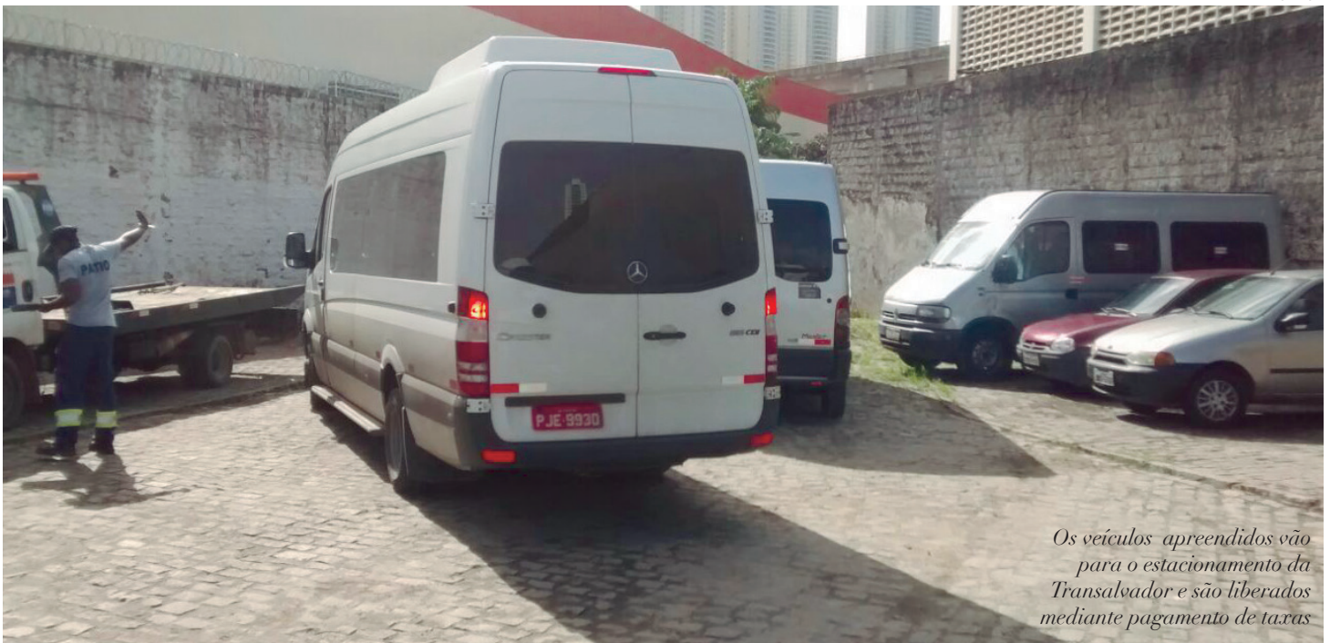
Os veículos apreendidos vão para o estacionamento da Transalvador e são liberados mediante pagamento de taxas