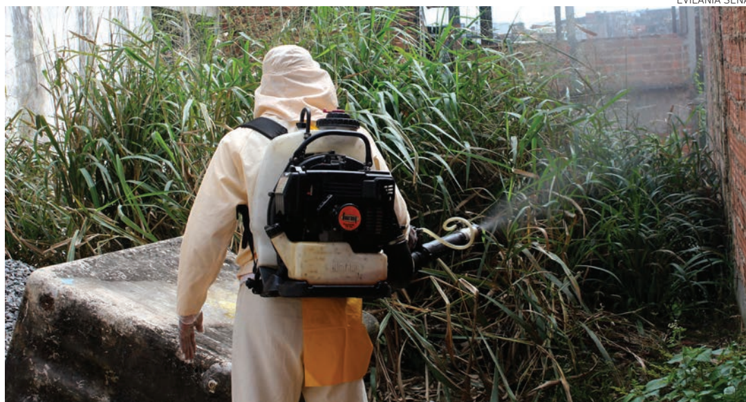
A redução da incidência da dengue é atribuída ao trabalho preventivo intensificado em bairros prioritários