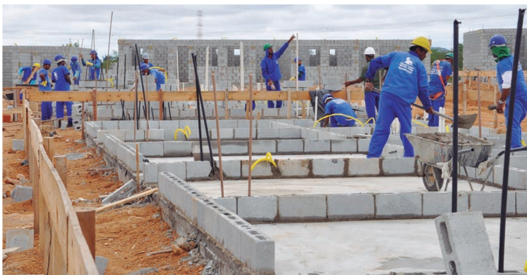
As ações coincidem com o momento de crise enfrentado pelo país e que atinge setores como a construção civil

O documento propõe ainda isenção do IPTU para imóveis destinados à construção de empreendimentos vinculados a programas habitacionais de interesse social, para família com renda mensal de até três salários mínimos, assim como aqueles utilizados pelos Povos e Comunidades de Terreiros Reconhecidos e registrados no banco de dados do município.