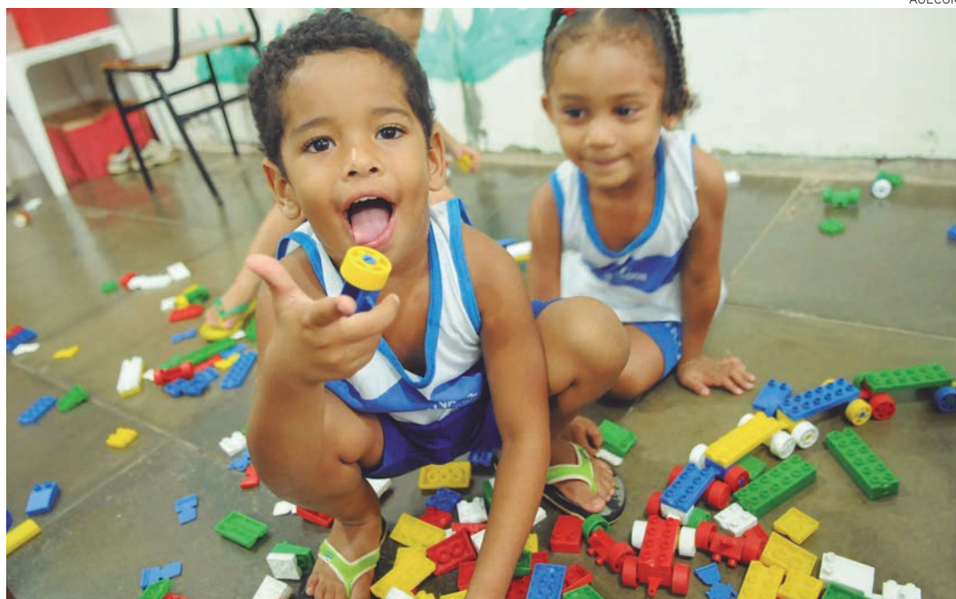
Programa é formado por um conjunto de 112 ações, voltadas para a melhoria da qualidade de ensino

e reconstrução de escolas, além da implantação do Programa Agentes da Educação, que já conta com programa-piloto instalado em 11 unidades de ensino. Representantes das instituições parceiras, diretores, vice-diretores e demais professores da rede também participam do lançamento.