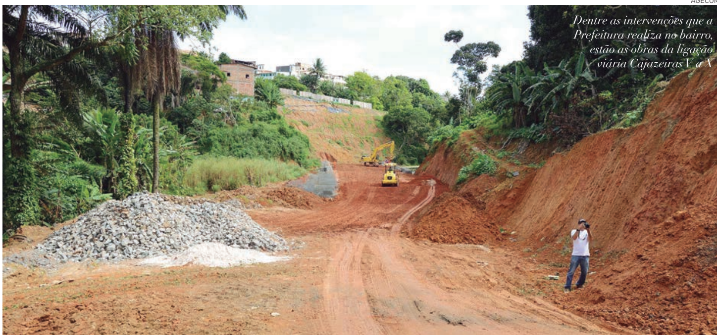
Dentre as intervenções que a Prefeitura realiza no bairro, estão as obras da ligação viária Cajazeiras V a X

A ligação Cajazeiras V a X é a terceira grande intervenção pela mobilidade urbana em Cajazeiras, somando-se à Rua Lourival Costa, já inaugurada, e a construção da nova via para a BR-324, em andamento. A ligação terá um binário (duas vias, uma em cada sentido), numa área de 1,2 mil metros, atenuando um dos principais gargalos no trânsito da região. Já o Mercado de Cajazeiras tem estimativa de entrega em 90 dias, beneficiando 150 permissionários da região, através de um trabalho realizado em conjunto pela Secretaria Municipal de Ordem Pública (Semop) e por uma comissão formada por representantes dos próprios feirantes. O espaço conta com três pavimentos, praça de alimentação, banheiros com acessibilidade e rampas entre os pavimentos.