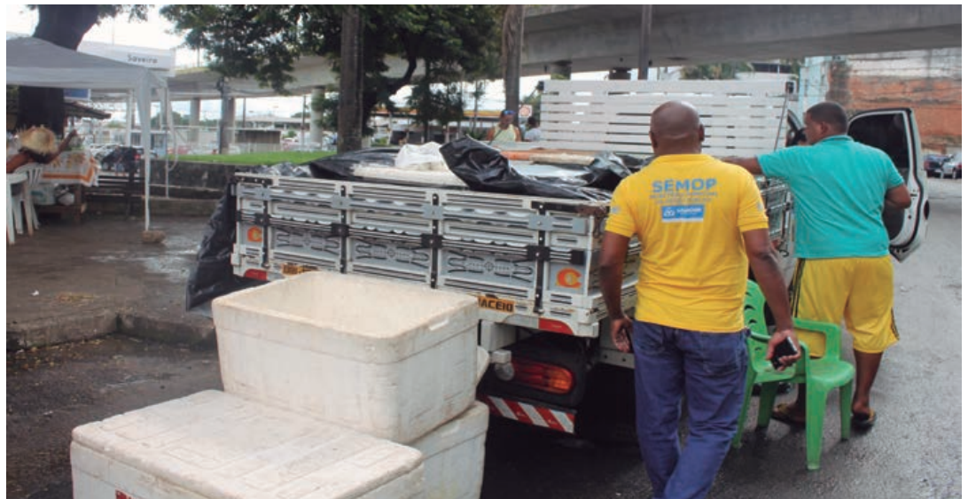
Comerciantes ilegais podem perder suas mercadorias caso sejam flagrados vendendo os pescados na rua