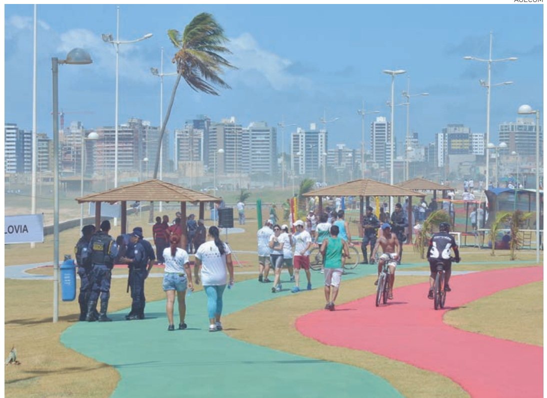
Praça na Boca do Rio é um dos espaços requalificados onde a população pode se divertir no recesso junino

vido pela Secretaria de Promoção Social, Esporte e Combate à Pobreza (Semps), e que tem por objetivo levar ações de entretenimento para crianças e adolescentes de diversas comunidades da cidade. O Ruas de Lazer ocorre das 8h às 14h, na Praça da Mortadela, no bairro de Águas Claras. Dentre os espaços requalificados à disposição da população vale destacar as praças Irmã Dulce, no Largo de Roma, Wilson Lins, Ana Lúcia Magalhães e Nossa Senhora da Luz, na Pituba, além dos novos equipamentos no Imbuí, Boca do Rio e na Avenida Garibaldi. A Praça Dois de Julho, no Campo Grande, é outra boa opção de lazer.