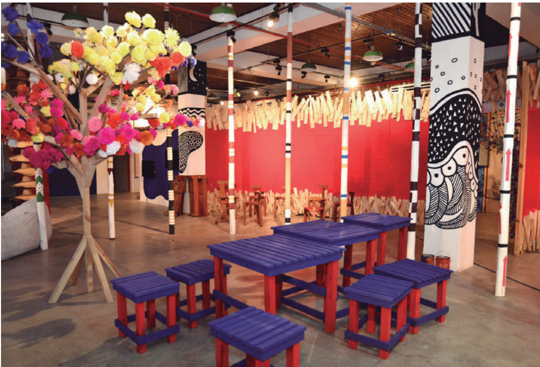
A reforma conservou as características originais do teatro, que está apto a receber diversas linguagens artísticas