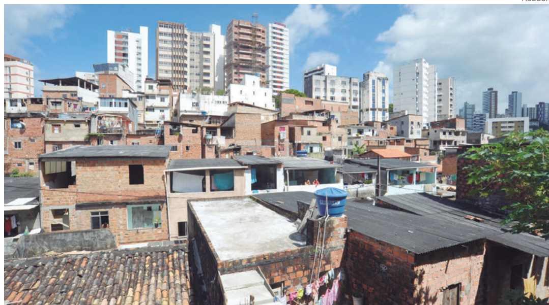
O Calabar está entre os 16 bairros que o programa vai atacar inicialmente, melhorando o conforto e a estética

No primeiro ano, acrescentou o prefeito, serão contemplados 51 bairros, com 16 primeiros prioritários. Inicialmente, vamos verificar quais são as prioridades da casa, que pode ser um banheiro ou a pintura, o reboco”. Pág. 3