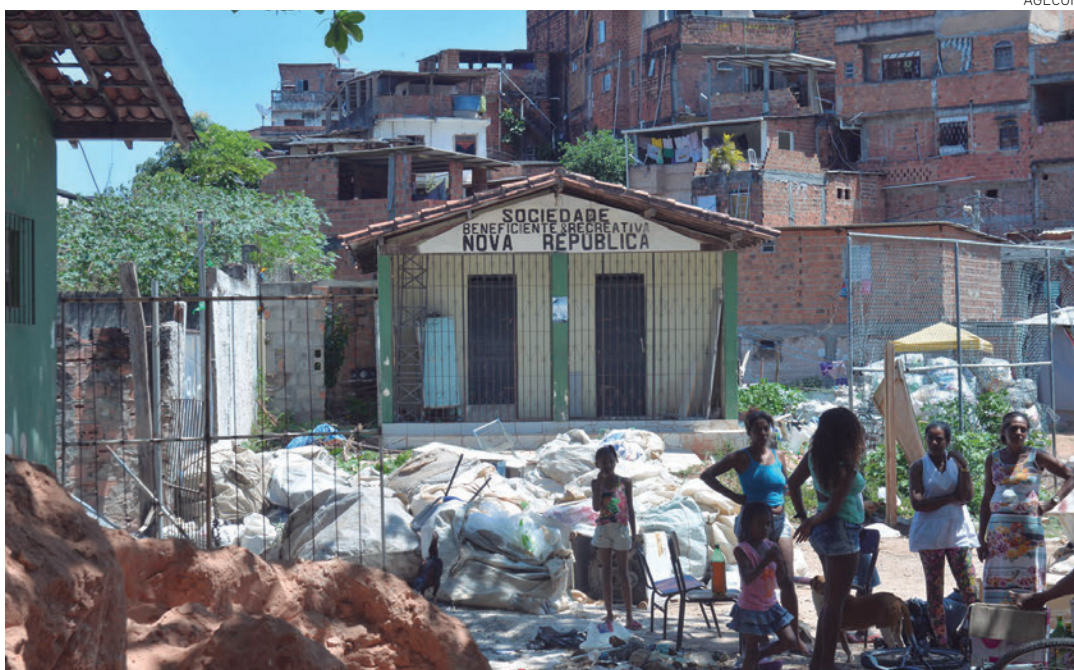
A iniciativa também vai permitir a melhoria da saúde da população, provendo condições mais saudáveis

Morar Melhor vai beneficiar 100 mil imóveis, com investimento de R$ 500 milhões